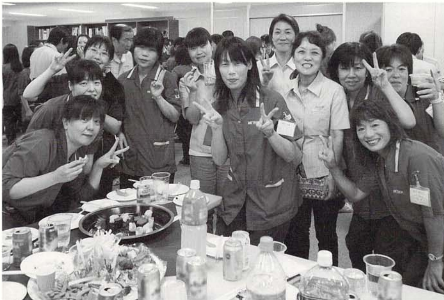
オフィスで行われる社内交流イベント。