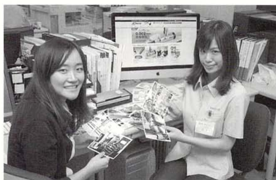
同社で活躍する若手女性社員。