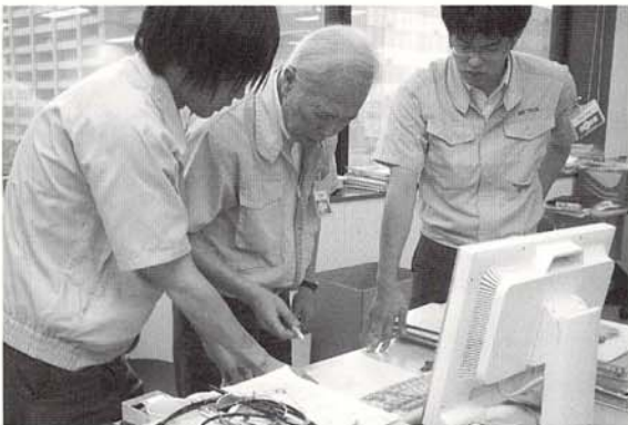
20～80代の幅広い年齢層の人材が、チームワークを発揮しながら能力を活かしている。

を求められるため、熟練した技術が不可欠となる。そのためパート社員を戦力と位置づけ、長期雇用を前提とした処遇を基本としている。パート社員といえども、1日6時間と短い勤務時間を除けば、仕事と待遇は正社員と同じだ。例えば女性パート社員（妻）が週5日制で、いわゆる103万円の壁（妻の年収が103万円以下なら、夫の税金が軽くなる仕組み）、130万円の壁（妻の年収が130万円未満なら、夫の扶養家族とされて、年金や健康保険の保険料を支払わなくても済む仕組み）を気にして働くことを想定していない。1年ごとの有期労働契約だが、本人が希望する限り雇用を継続するため、平均勤続年数は5年以上、最長25年の社員もいる。2013年4月1日の労働契約法の改正施行により有期労働契約が反復更新されて通算5年を超えたときに、労働者の申し込みによって無期労働契約に転換する必要（無期転換ルール）が生じても、人件費等への影響はないといえる。社会保険に加入し、正社員の水準には満たないが賞与も年3回支給される。